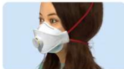
A haj nincs összefogva