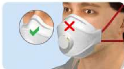
A maszk orrpántja nincs leszorítva