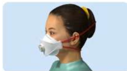
A pánt a fülön átvezetve