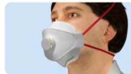
A maszk fordítva van (orr-rész alul)