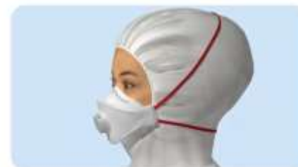
A maszk a csuklya felett