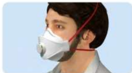
A maszk szakáll miatt nem illeszkedik