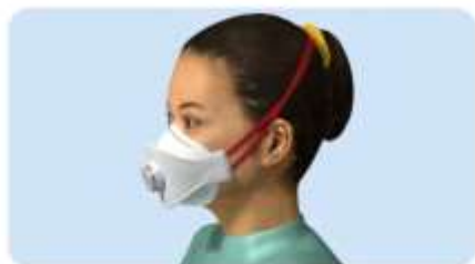
A pántok nem megfelelő helyen