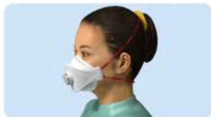
A pántok összetekeredtek