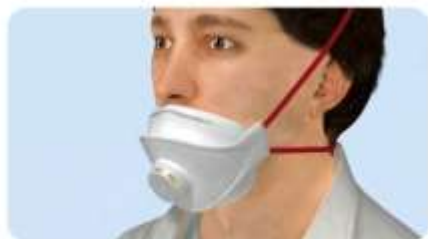
A maszk nem fedi az orrot