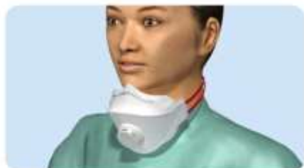
A maszk nem fedi az arcot