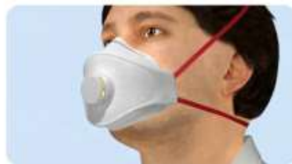
A maszk nincs teljesen széthajtva